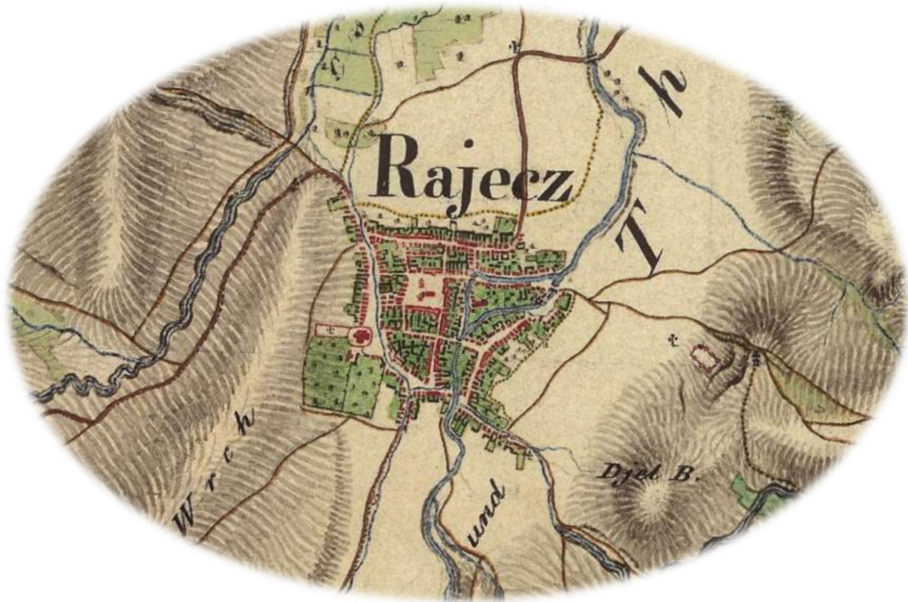
Mapa č. 13. Rajec z XIX stor.